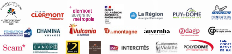
Illustration principale : Véro Béné | Graphisme : Jean-Louis Massardier