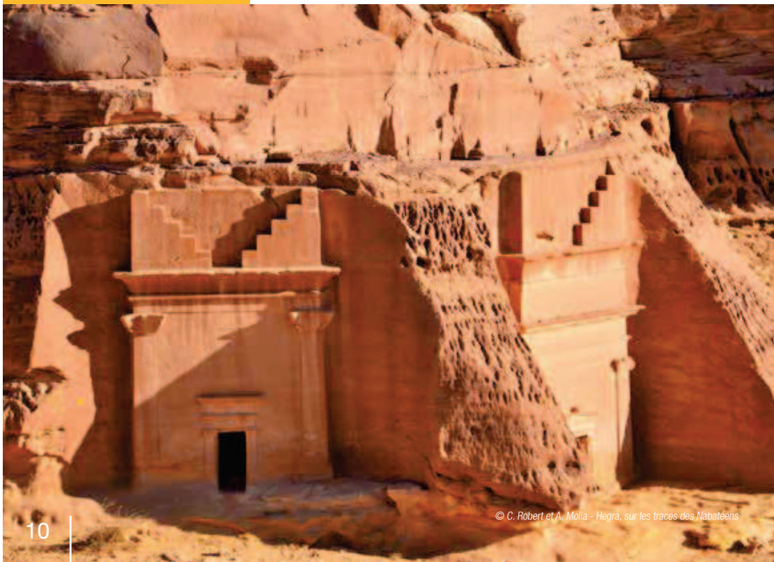
Hegra, sur les traces des Nabatéens

De Peau d'âme — un épiluchage original du tournage de Peau d'âne — à Spartacus , en passant par Viking, cap sur l'Amérique ou encore Le dernier Gaulois , il y en a pour tous les goûts !