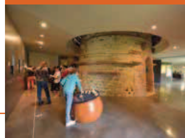
Les visiteurs découvrent le musée

Dimanche 18 juin à 14 h 15 (de 6 à 9 ans)